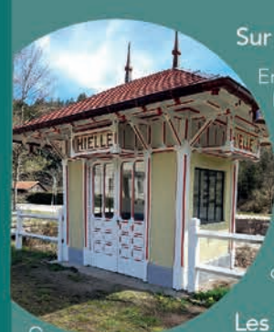
Gare de Hielle

Sur les traces d'une activité ferroviaire