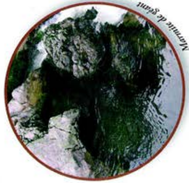
Marmite de géant

Dès l'entrée du site, on observe des « marmittes de géant » sur le cours de la Moselotte : il y a des milliers d'années, des galets entraînés dans un tourbillon ont fini par creuser la roche sous le glacier.